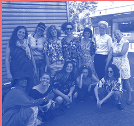
משתתפות הסדנה במרחב השכונה

מנהל קהילה, תרבות ומסרים | אגף קהילה דרום | מרחב דרום שטוב | אגף תרבות ואמנותיות מרכז קהילתי הגרמי, רחוב הגרמי 28, תל-אביב-יפו